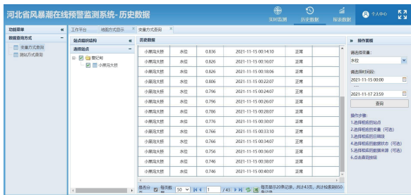
图 2 部分历史采集数据

在前期进行大量实验研究的基础上,作为应用示范,在河北唐山曹妃甸区小黑沟大桥进行了河北省智能型警戒潮位监测点的建设并进行了运行实验。在小黑沟监测点每 2 min 采集一次数据,选取 2021 年 11 月 15 日全天 24 h 实测潮位数据通过 Excel 处理后与天文潮曲线进行对比,对监测数据的稳定性、随潮性进行拟合分析(图 2 和图 3)。与天文潮曲线的对比结果表明,监测数据无跳动,基本消除了波浪对数据采集的影响。通过连续观测数据生成的潮位曲线与天文潮曲线基本一致,达到了较好的随潮性。